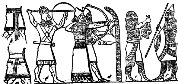
...האָרטען איז די אלטע צייט:

אז הוררום איז אָנגעקומען מיט די רוימער, האָט זיך דאָס גאַנצע לאַנד געשמעלט געגען איהם. לעבען יריחו איז פאַרגעקומען אַ גרויסע שלאַכט און יוסף, הוררוס'עם ברודער,